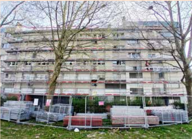
Délimitation des zones de chantier