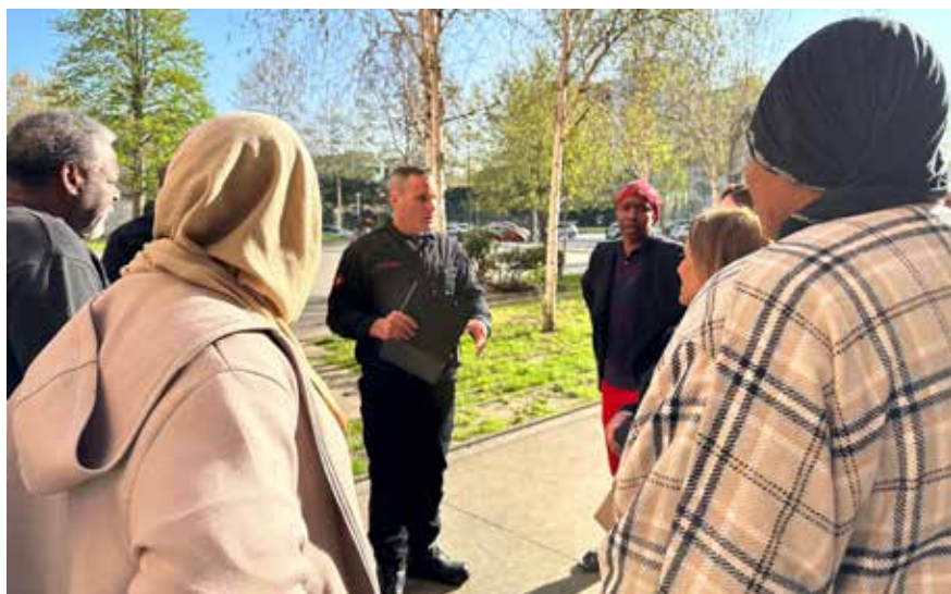
Les pompiers expliquent aux locataires le déroulement de l'exercice