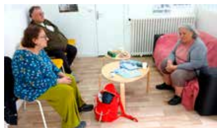
Un local dédié à l'accueil et à l'information des locataires