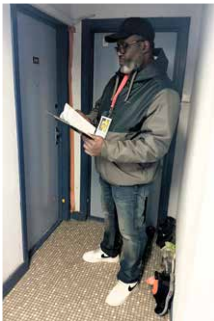
Information des locataires via une campagne de porte-à-porte

Depuis plusieurs semaines, une recrudescence de cafards a été constatée à Gabriel Péri.