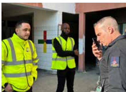
Les agents de l'OPH et les pompiers se coordonnent pour une meilleure efficacité en cas de danger