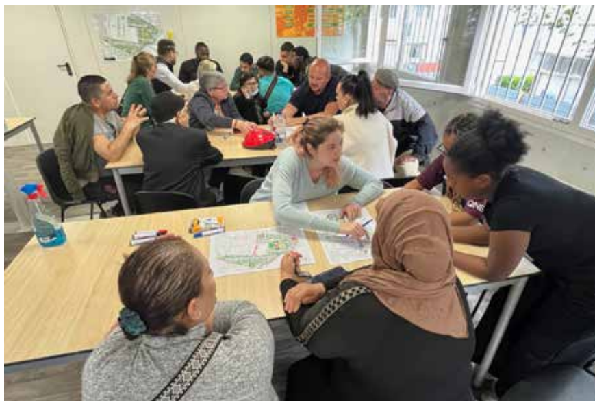
Ateliers concertation avec les habitants de Gabriel Péri.