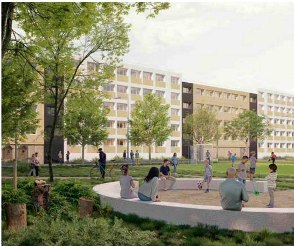
Projection 3D du projet de réhabilitation de la cité Emile Dubois.