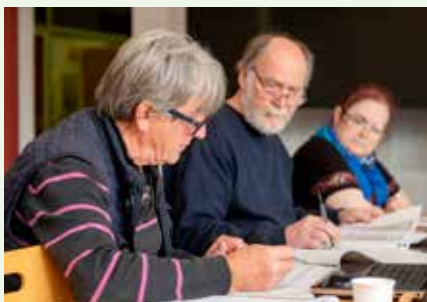
Les amicales de locataires en plein travail de vérification des factures.

Nous venons de lancer les régularisations de charges pour les années 2020, 2021, 2022 et 2023. Vous étiez favorable au traitement des 4 années, pourquoi ?