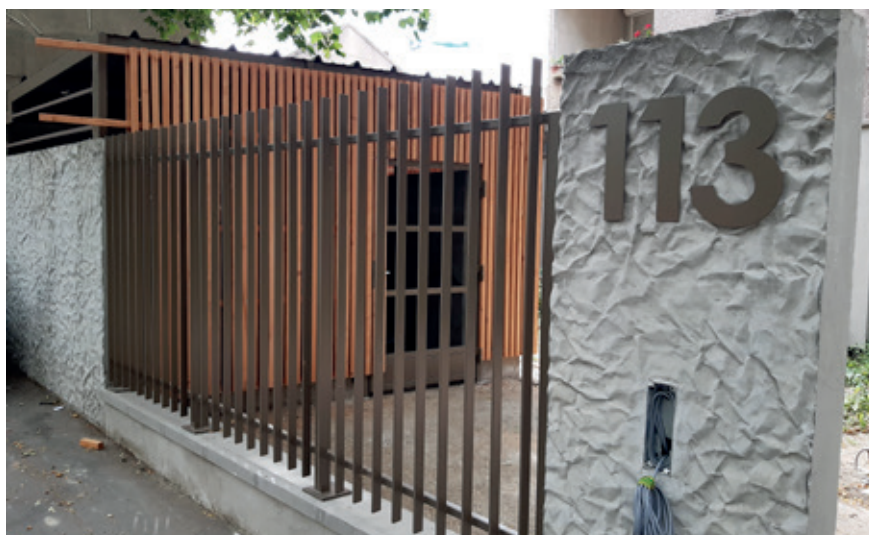
Travaux de résidentialisation au 113-117 rue André Karman

Pendant la crise sanitaire COVID-19, la cité République a connu des perturbations à cause de l'accumulation des poubelles et des encombrants. Il