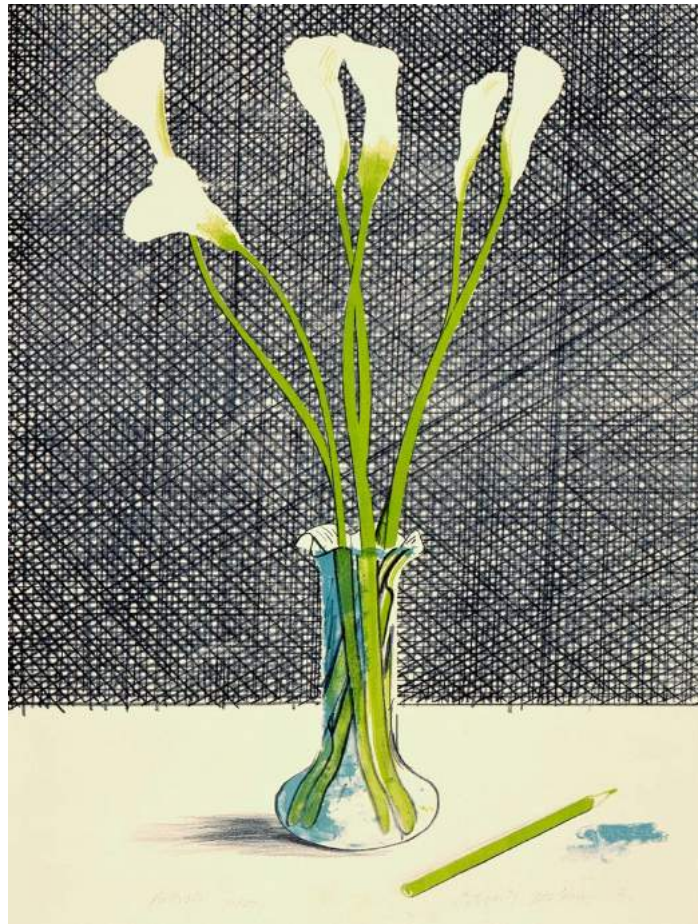
David Hockney, Lillies , 1971, Lithographie

Au long des siècles, les fleurs ont fasciné et fascinent toujours les artistes. Le traitement des fleurs et des plantes trouve ses correspondances dans celui du nu et en particulier du nu féminin en passant par la nature morte, du Romantisme jusqu'aux représentations modernes et contemporaines. Il s'agit, là aussi, de trouver l'essence de la nature, à la fois dans sa complexité et sa délicatesse.