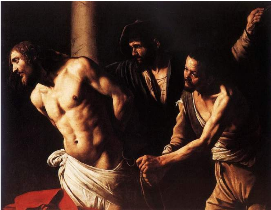
Le Caravage, La flagellation du Christ , 1607

L'emploi du clair obscur peut transformer radicalement le visible et le transgresser. Son créateur fut Michelangelo Merisi da Caravaggio (1571 - 1610) dont la modernité a bouleversé la vision de la peinture. Sa nouvelle forme de "captation" a révolutionné la donnée du corps en tant qu'entité.