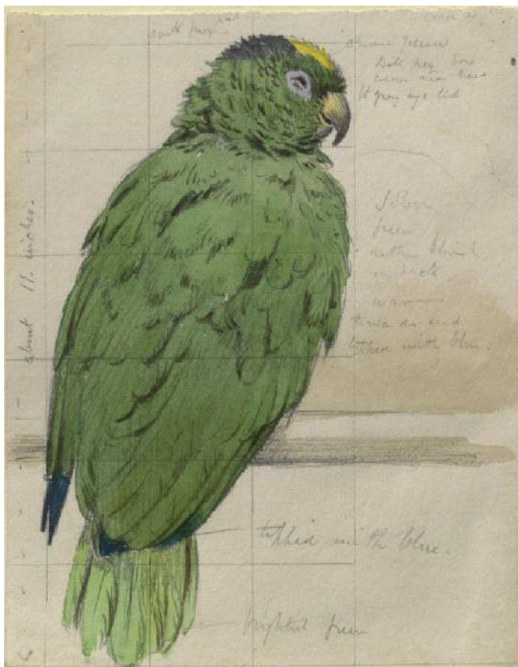
Etude d'oiseau, Henry Stacy Marks

Du reptile prenant la pose aux aras se chamaillant, nous prendrons comme modèle le monde animal et l'environnement artificiel que lui propose le parc zoologique de Paris. Une journée passée outils en main pour saisir le vivant et sa diversité de formes, de couleurs, de matières.