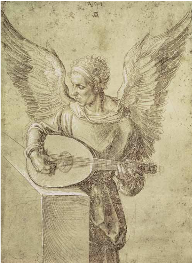
Albrecht Dürer, Ange jouant au luth , 1491

Figure de l'interstice, éthérée, asexuée, extraterrestre biblique, incarnation de la beauté - la représentation de l'ange est aussi délicate que son origine et sa fonction sont mystérieuses.