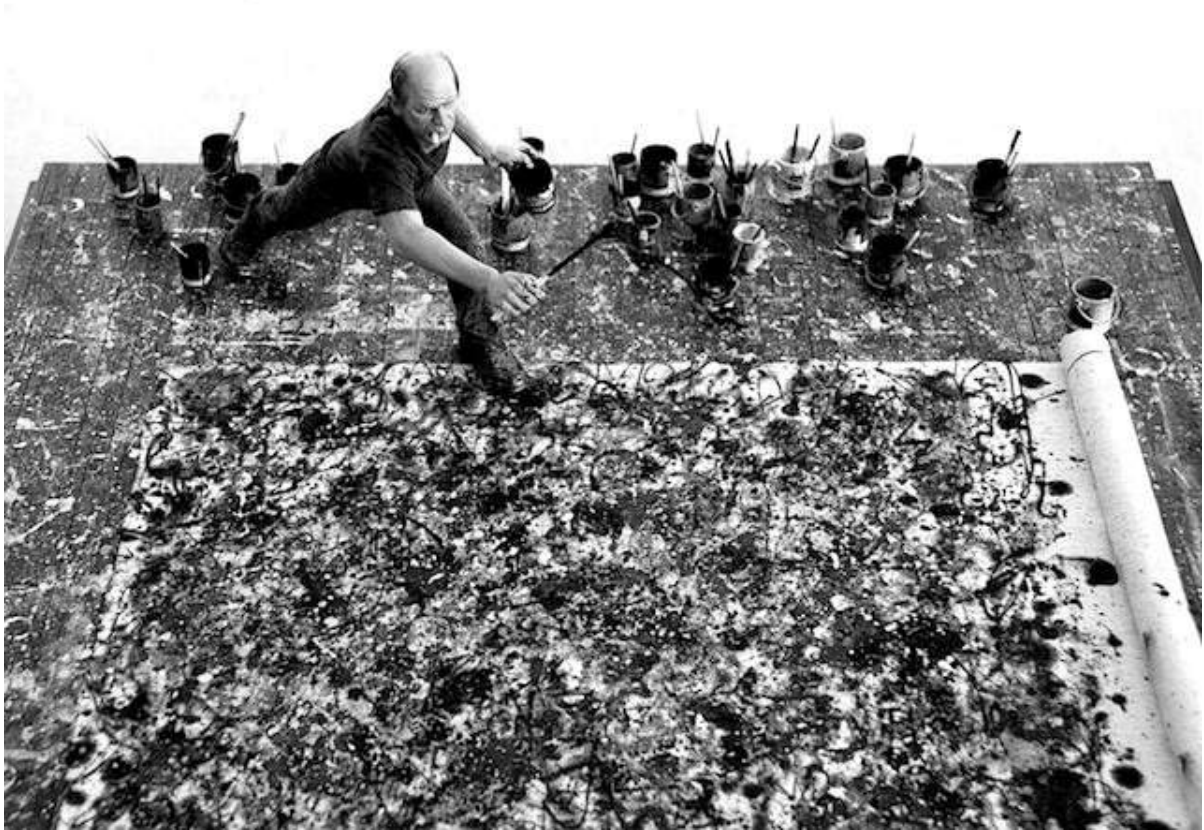
Jackson Pollock, 1951, NY