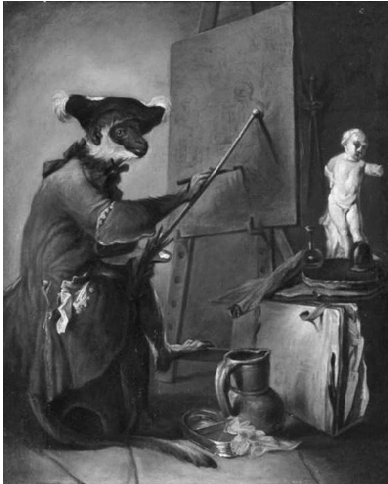
Jean Siméon Chardin, Singe peintre , 1740