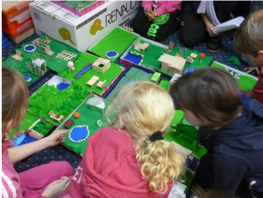
Atelier enfants à l'International School of Paris, 2014

L'artiste propose aux enfants (et aux parents qui le souhaitent) de vivre une expérience artistique, ludique et inventive durant laquelle ils pourront laisser libre cours à leur imagination, en créant leur jardin miniature à la manière de ceux, magiques, venus de l'extrême Orient.