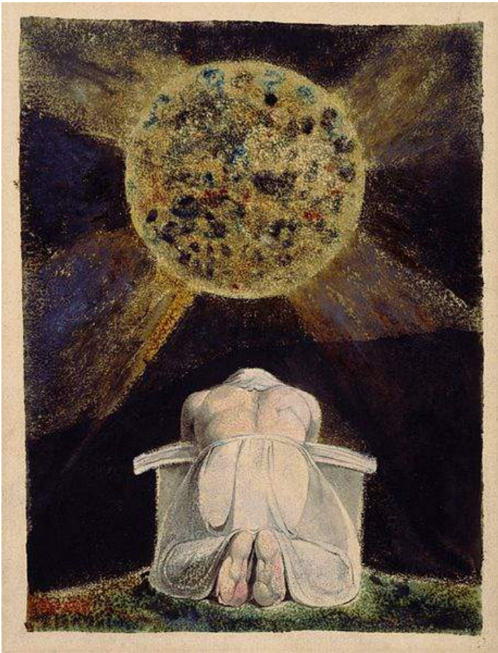
William Blake, The Song of Los , 1795

Tout corps appartenant à la surface d'une feuille ou d'une toile crée au delà de sa propre représentation un espace, voire une perspective. C'est aussi le degré de sa profondeur qui le fait exister. Le mouvement d'un modèle engendre différentes perspectives selon différents points de vues passant de l'image plane aux trois dimensions. Cet effet tient aux raccourcis, et parfois à l'utilisation des raccourcis extrêmes, un choix fait par nombreux artistes en quête pour capter le mouvement et la présence physique de leurs sujets.