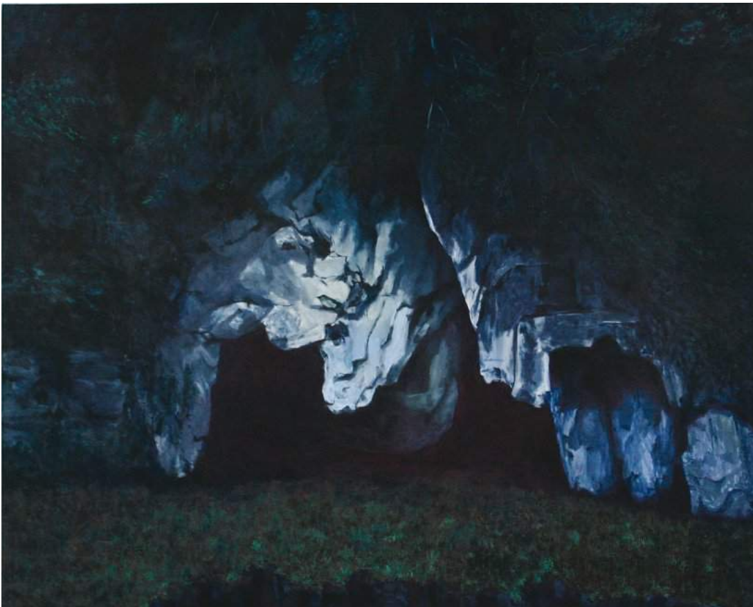
Grotte , huile sur toile, 120 x 150 cm, 2014