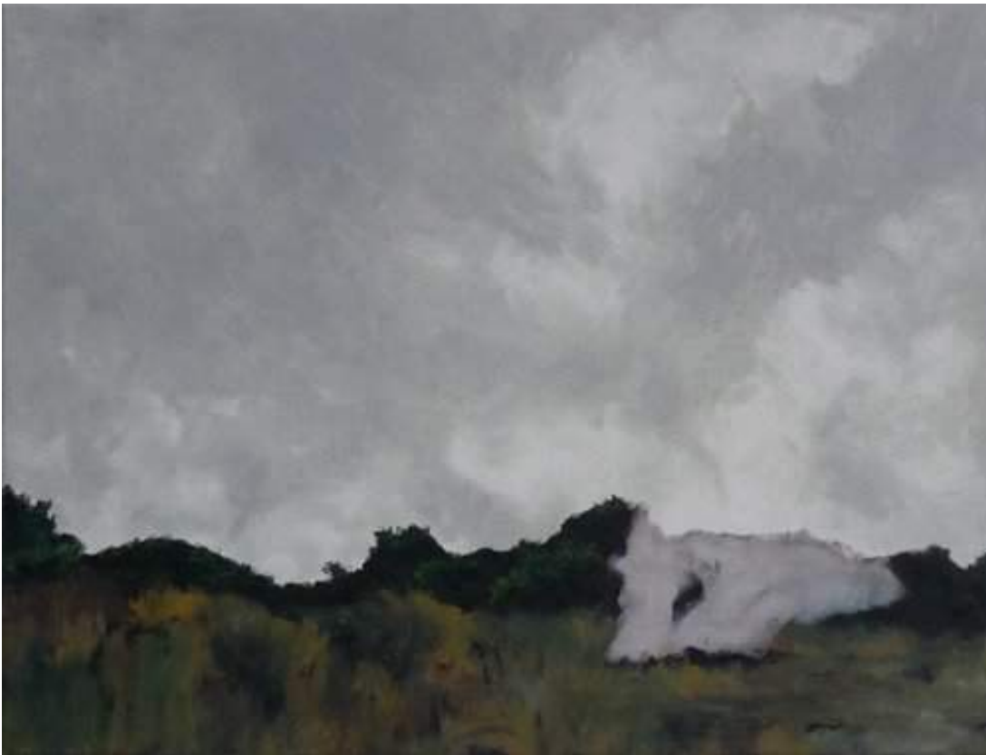
Le Départ , huile sur toile, 38 x 50 cm, 2014