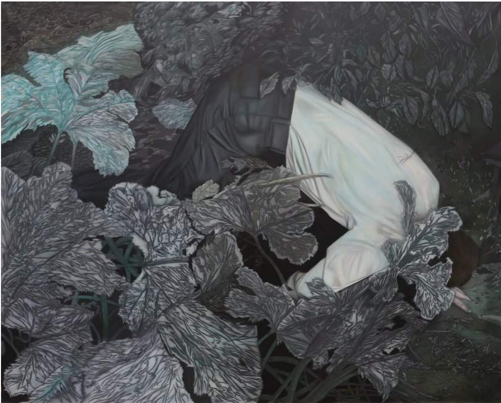
Sans titre , technique mixte sur toile, 162 x 130 cm, 2017