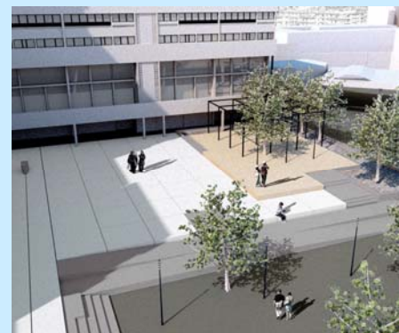
Vue du nouveau parvis

Tout au long de l'élaboration, les locataires comme l'OPH ont été particulièrement vigilants à la sécurisation des espaces, notamment du parvis et du square, à l'amélioration de l'éclairage, la limitation de la circulation des 2 roues ainsi qu'à