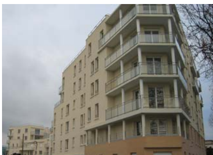
2 passage Moglia, 32 appartements locatifs

Des halls chaleureux protégés par des digicodes mènent aux ascenseurs desservant les étages supérieurs et les parkings.