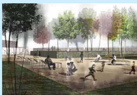
Esquisse du nouveau square

Après de multiples rencontres entre novembre et décembre derniers, le projet d'aménagement des espaces extérieurs tenant compte des recommandations faites précédemment était présenté aux locataires.