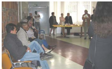
Café croissant pour accueillir les nouveaux locataires

En un an, une centaine de nouveaux habitants ont rejoint la cité République fraîchement réhabilitée. L'OPH et sa MOUS