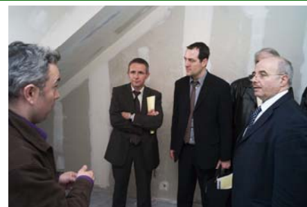
Présentation de l'état d'avancement du chantier

Les travaux de transformation auront nécessité une restructuration complète des logements ainsi qu'une reprise totale de la plomberie, de l'électricité, du chauffage et de la ventilation. A indiquer aussi que des panneaux solaires fourniront de l'énergie pour produire l'eau chaude sanitaire. Cette réhabilitation a bénéficié du certificat «Qualitel Patrimoine et Habitat». Les travaux de transformation auront duré plus d'un an.