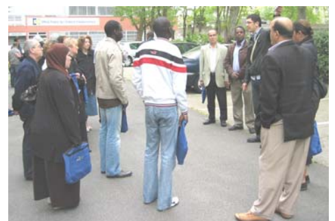
Tour de ville avec les nouveaux locataires